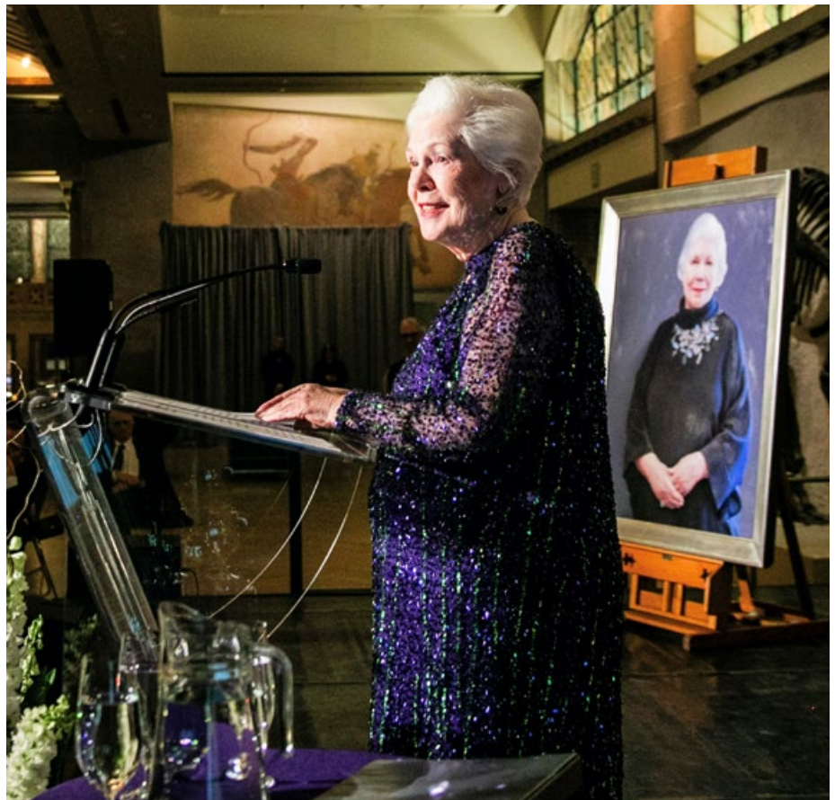
Mme Dowdeswell prend la parole lors d'un événement hommage organisé en son honneur par le gouvernement de l'Ontario.

Le Bureau de la lieutenant-gouverneure a soutenu Mme Dowdeswell dans ses nombreuses activités, incluant des visites dans chacune des 100 municipalités et 124 circonscriptions de l'Ontario, ainsi que des représentations internationales. Parmi ses engagements à l'étranger, elle a rencontré Sa Majesté la reine Elizabeth II à Londres, accompagné des élèves canadiens à la crête de Vimy en France, pris la parole au Sommet des maires C40 au Danemark et s'est exprimée devant les Nations Unies aux États-Unis.