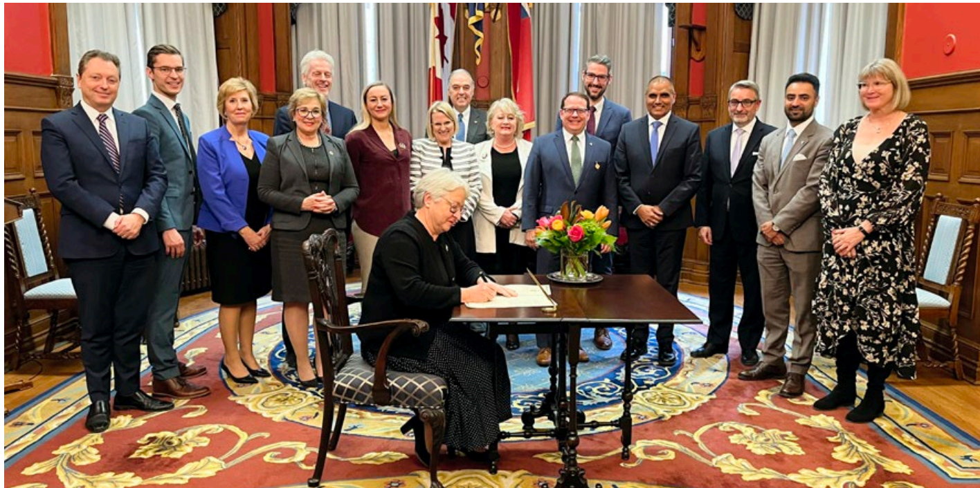
Mme Dumont préside sa première cérémonie de sanction royale.

Conformément aux pratiques habituelles, Mme Dowdeswell et Mme Dumont ont tenu des réunions régulières avec le premier ministre. Ces rencontres, confidentielles par nature, visent à favoriser des échanges ouverts et constructifs, conformément à la pratique britannique de conversations privées entre le souverain et le premier ministre.