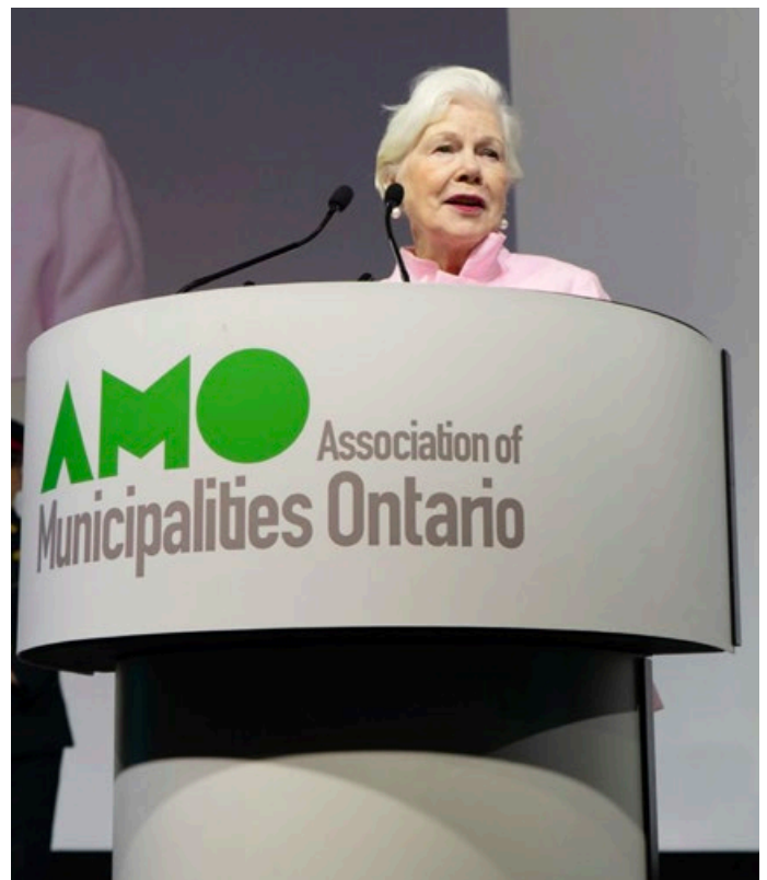
Mme Dowdeswell prononce un discours lors de la conférence annuelle 2023 de l'Association des municipalités de l'Ontario à London.

— Mme Dowdeswell, allocution d'introduction au débat du Collège Glendon : La démocratie est-elle brisée?