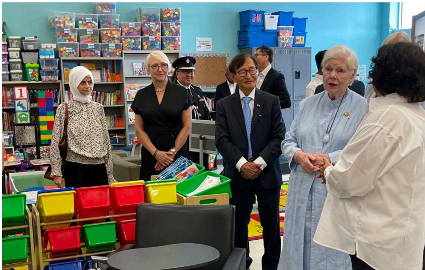
À Scarborough, Mme Dowdeswell visite le Parents Engaged in Education Centre avec l'honorable Raymond Cho (député provincial de Scarborough-Nord et ministre des Services aux aînés et Accessibilité).