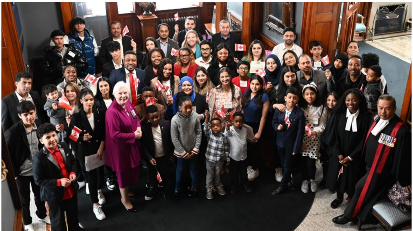
Mme Dowdeswell en compagnie de Canadiennes et Canadiens et de leurs proches après une cérémonie de citoyenneté tenue dans ses appartements.