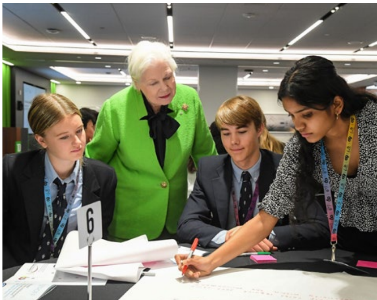
Mme Dowdeswell échange avec des élèves du secondaire de la région de Toronto lors de l'événement « Le Prix du Duc d'Édimbourg en action ».

— L'honorable Edith Dumont, discours d'installation