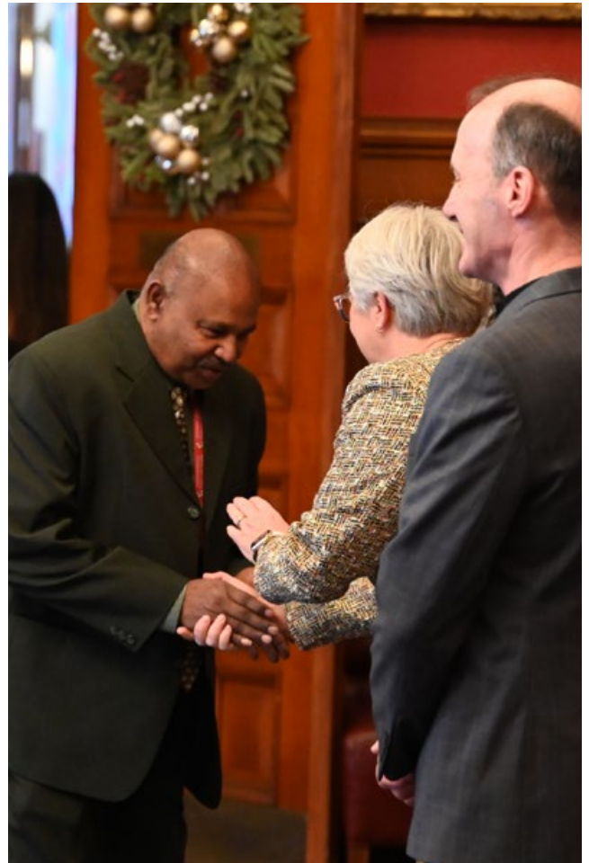
Mme Dumont accueille des visiteurs lors de la réception du Nouvel An 2024 dans les appartements de la lieutenant-gouverneure.

— L'honorable Edith Dumont, discours d'installation