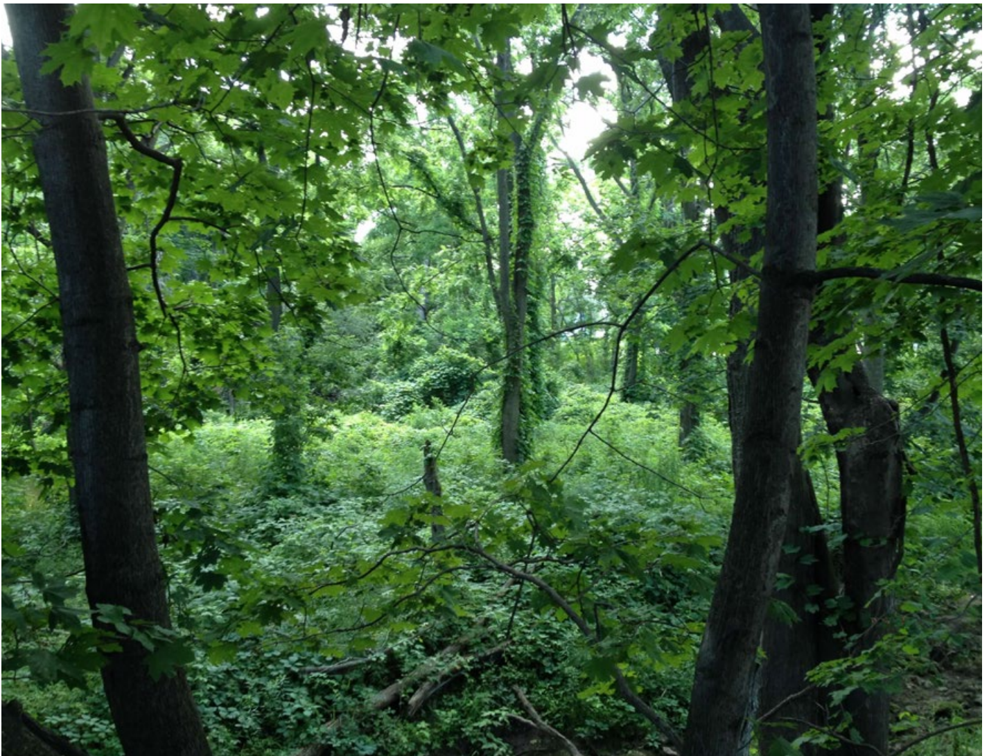
La région naturelle de Souharissen à Hamilton, en Ontario.

Le Bureau est situé dans les appartements de la lieutenant-gouverneure, à Queen's Park, à Toronto, un lieu de rassemblement traditionnel pour de nombreux peuples autochtones de l'Île de la Tortue, notamment les Anichinabé, les Haudenosaunee et les Wendat. Toronto se trouve sur le territoire visé par le Traité 13, une entente conclue avec les Mississauga de Credit, à qui nous rendons hommage.