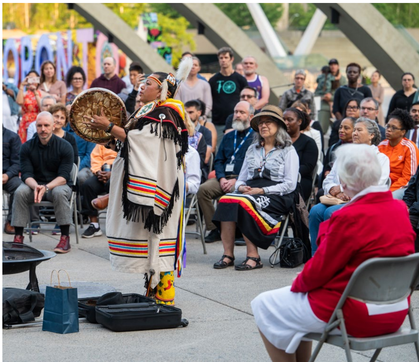
Mme Dowdeswell participe à une cérémonie au lever du soleil lors de la Journée nationale des peuples autochtones, coanimée par Kim Wheatley, une aînée Anichinabée.

• Visites dans les communautés autochtones et rencontres avec des leaders autochtones : Lors de sa première visite officielle dans une municipalité, à Orillia, Mme Dumont a rencontré le groupe des femmes autochtones de la région pour échanger sur les projets d'expansion d'un nouveau centre et le développement de programmes.