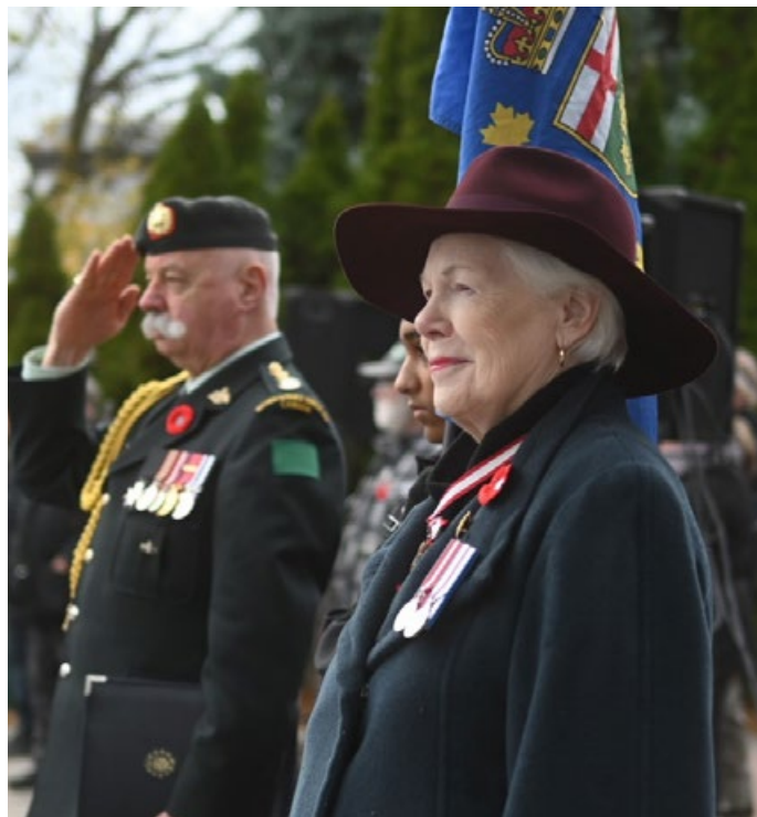
Mme Dowdeswell lors de sa dernière sortie publique à titre de lieutenant-gouverneure, à l'occasion d'une cérémonie du jour du Souvenir à Bowmanville, le 11 novembre 2023.

Pour en savoir plus sur les réalisations de Mme Dowdeswell au cours de son mandat, veuillez consulter le Rapport de fin de mandat disponible sur le site Web de la lieutenant-gouverneure de l'Ontario, à l'adresse lgontario.ca .