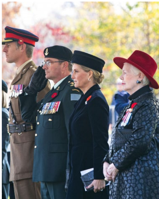
Mme Dowdeswell aux côtés de la duchesse d'Édimbourg lors d'un événement du jour du Souvenir organisé par le régiment Lincoln and Welland à St. Catharines.