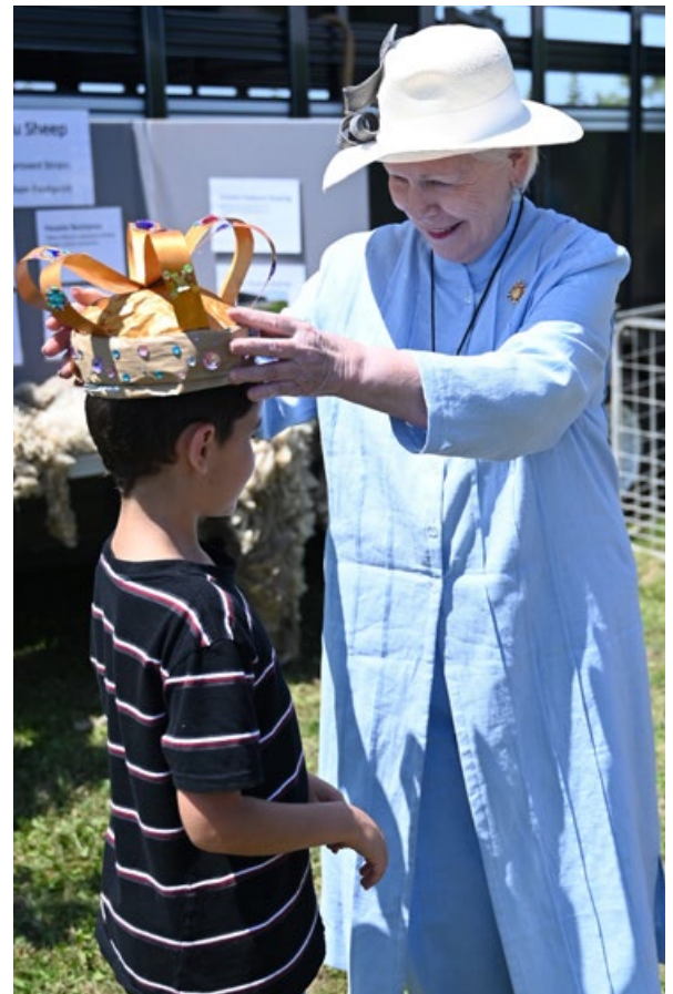
Mme Dowdeswell place une couronne sur la tête d'un enfant participant à la célébration du couronnement, à la ferme Clearwater, à Willow Beach.

— L'honorable Elizabeth Dowdeswell, cérémonie de lever du drapeau du couronnement, à Queen's Park