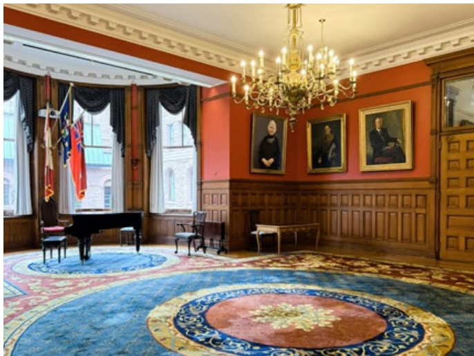
Salle de musique