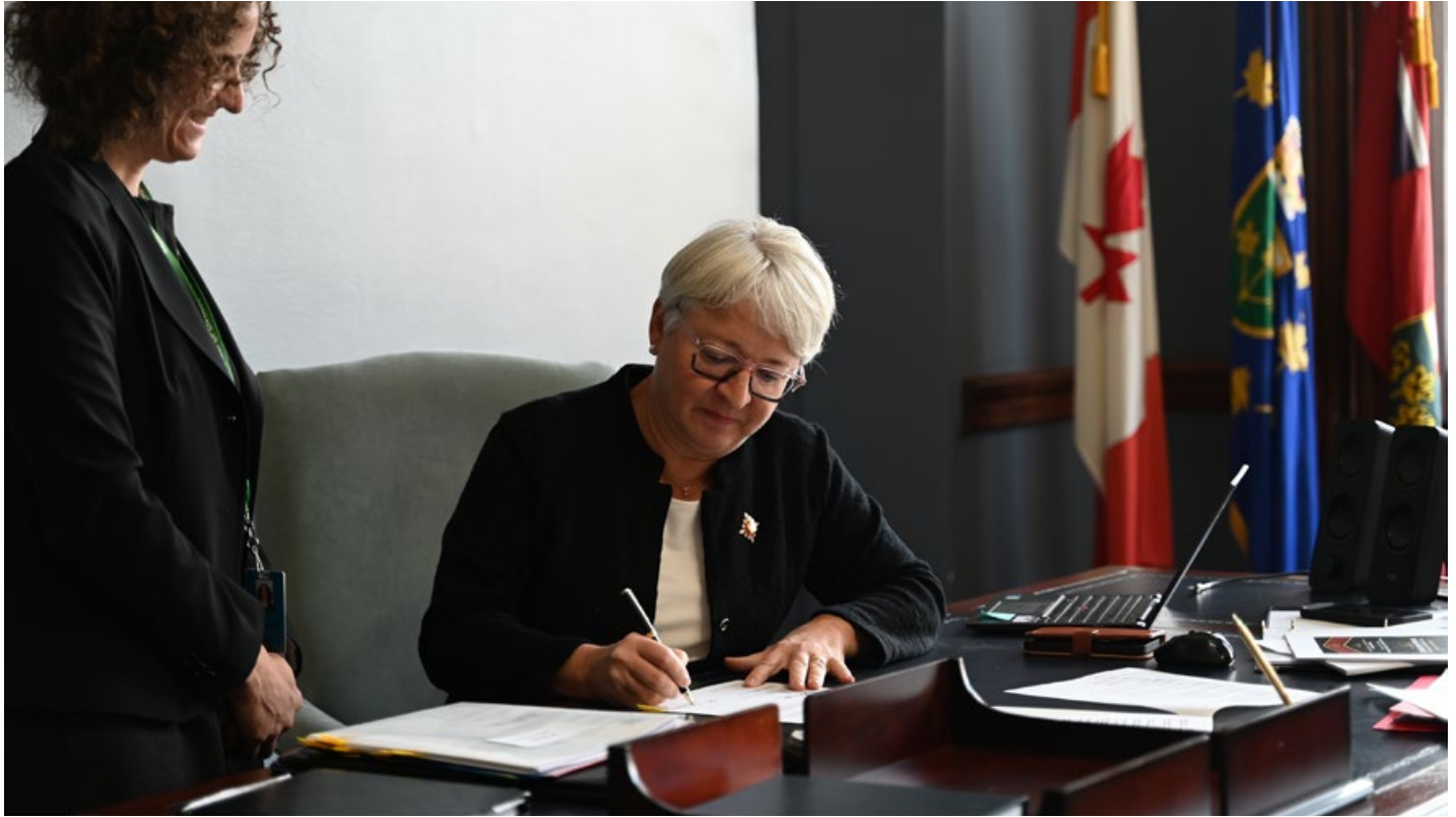
Mme Dumont signe sa première série de décrets.

« Je m’engage solennellement à remplir fidèlement les fonctions de lieutenant-gouverneure de la province de l’Ontario et à administrer la justice de manière équitable et impartiale. »