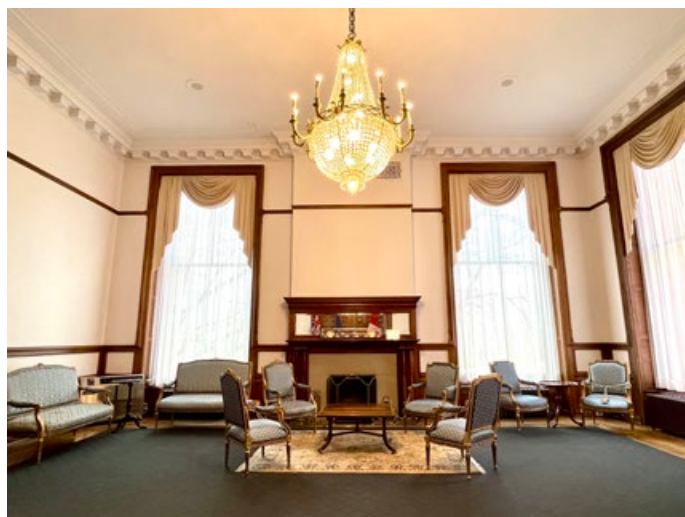
Salle de réception

Le Canada est une monarchie constitutionnelle où le monarque régnant, actuellement Sa Majesté le roi Charles III, occupe le rôle de souverain et de chef d'État. En Ontario, ce rôle est exercé par la lieutenante-gouverneure, actuellement l'honorable Edith Dumont, en tant que représentante du monarque. Dans le cadre du système de démocratie parlementaire du Canada, le chef d'État, souvent désigné sous le terme de la Couronne, détient un pouvoir suprême exercé au nom des citoyen.ne.s, lequel est