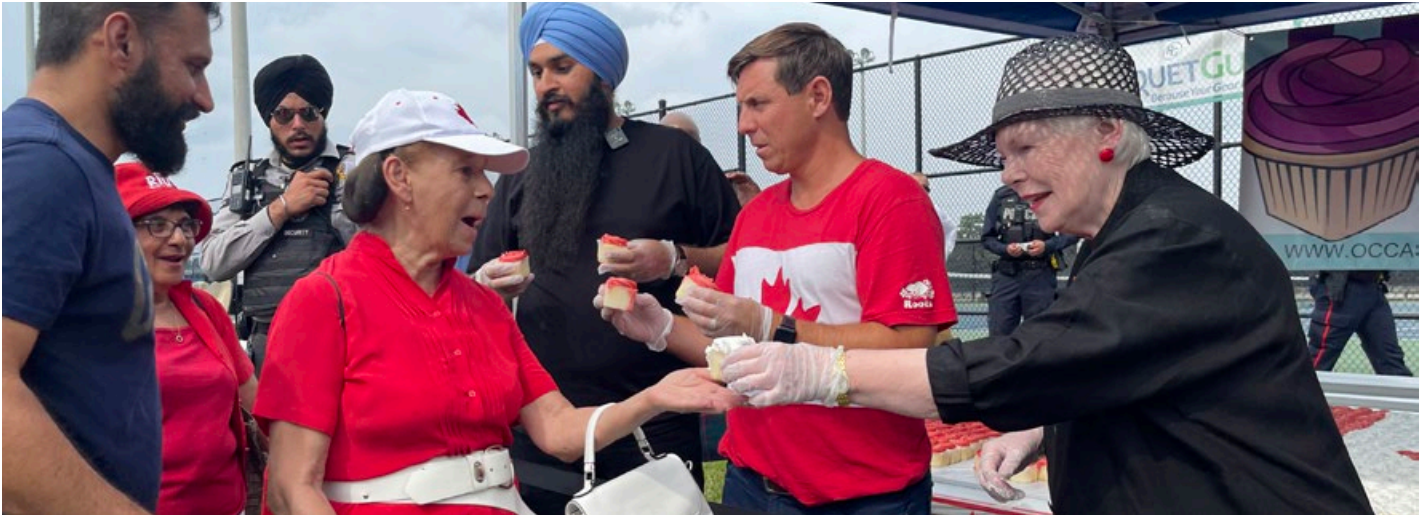
Mme Dowdeswell célèbre la fête du Canada au parc Chinguacousy à Brampton en distribuant des petits gâteaux avec le maire Patrick Brown.